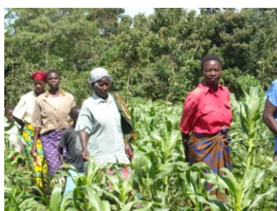
GEM EAST 村